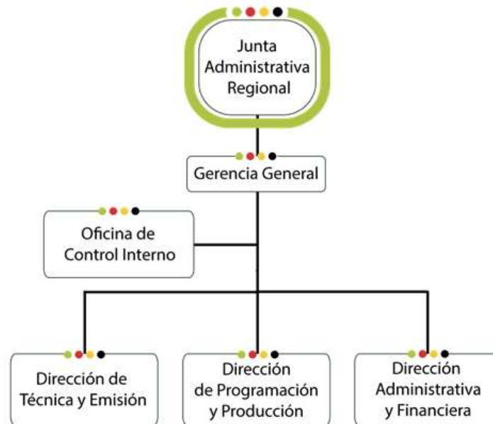
Ilustración 1. Estructura Organización de la Entidad