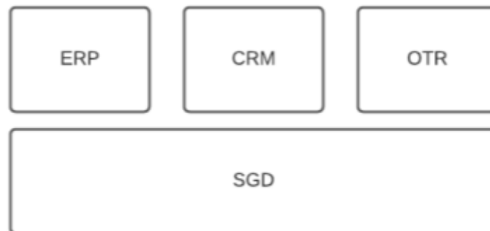
Ilustración 4. Sistema de información, innovación y seguridad